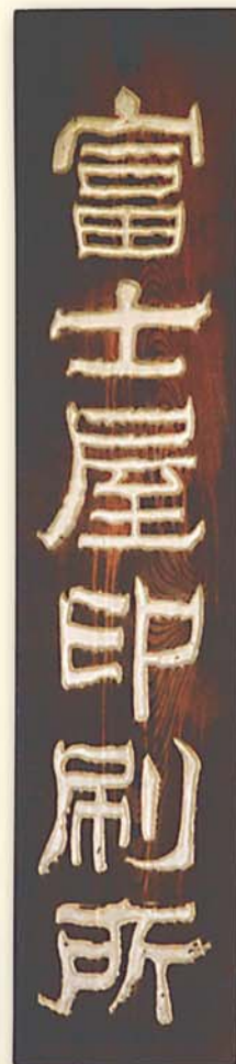
■ 明治二十八年、富士屋藤陽堂創業時チラシ