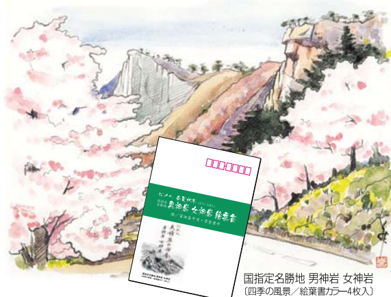
国指定名勝地 男神岩 女神岩 (四季の風景 / 絵葉書カラー4枚入)

現在も創業時からの「輪」は「和」の精神を基本に1人ひとりが取り組む仕事をはっきりと明確にし、個人が目標を立て、仕事に取り組んでいこうというやり方で経営を進めております。