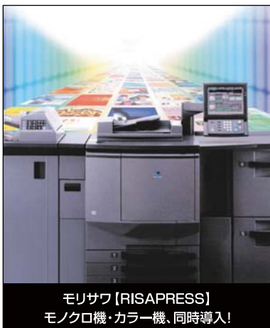
モリサワ【RISAPRESS】 モノクロ機・カラー機、同時導入!